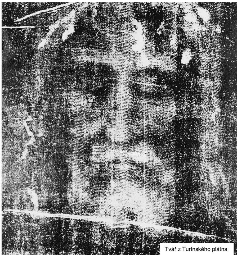
Tvář z Turínského plátna