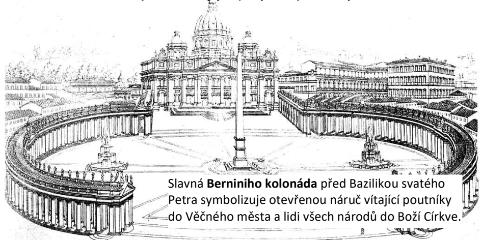
Slavná Berniniho kolonáda před Bazilikou svatého Petra symbolizuje otevřenou náruč vítající poutníky do Věčného města a lidi všech národů do Boží Církeve.

na louce nebo na úřadě je pro katolíky před Bohem neplatné – o životě „na hromádce“ ani nemluvě; a proč žít v hříchu a obírat sebe a rodinu o Boží požehnání...?), další by neměl(a) už dál odkládat přijetí svátosti smíření (svaté zpovědi) a smířit se s Bohem – nebo také možná i s někým ve svém okolí... Jiní jsou možná v situaci, kdy již jedno manželství před Bohem uzavřeli a proto vztah, ve kterém nyní žijí, úplně do pořádku dát nemohou. Ale i když proto někdo nemůže přijímat svátosti, může mnoha jinými způsoby žít naplno v Boží přítomnosti: modlit se, účastnit se bohoslužeb, dobře vychovávat děti, předávat jim víru... A jiný je zván, aby – i když má před Bohem vše formálně v pořádku – začal opravdu naplno s Bohem žít. Sám uvažuji o tom, co bych měl změnit ve své životě k lepšímu, když je nyní ta úžasná příležitost – Svatý rok. Něco, co jsem doposud odkládal... Kdy jindy než nyní...?!