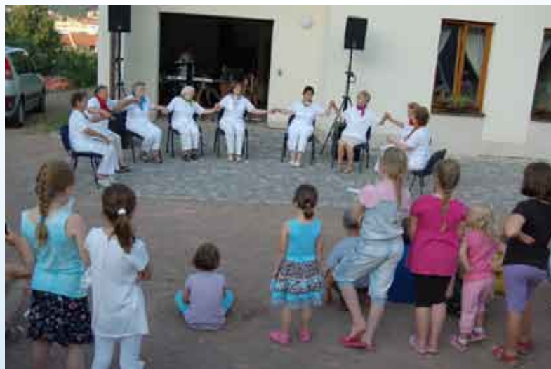
Seniorky z blanenského KLASu předvádějí tanec v sedě.

Ta příčina už je dávná – to se musíme ohlédnout až na konec 18. století, kdy se rodina začíná rozštěpovat. Není to tak, že bychom za to mohli zrovna my jako naše generace. Vše jen vnímáme jinak, než jak to bylo před těmi více než sto lety. Rodiny se vlastně začaly štěpit, když byla zahájena průmyslová výroba ve městech – tím se rozdělovaly ven-