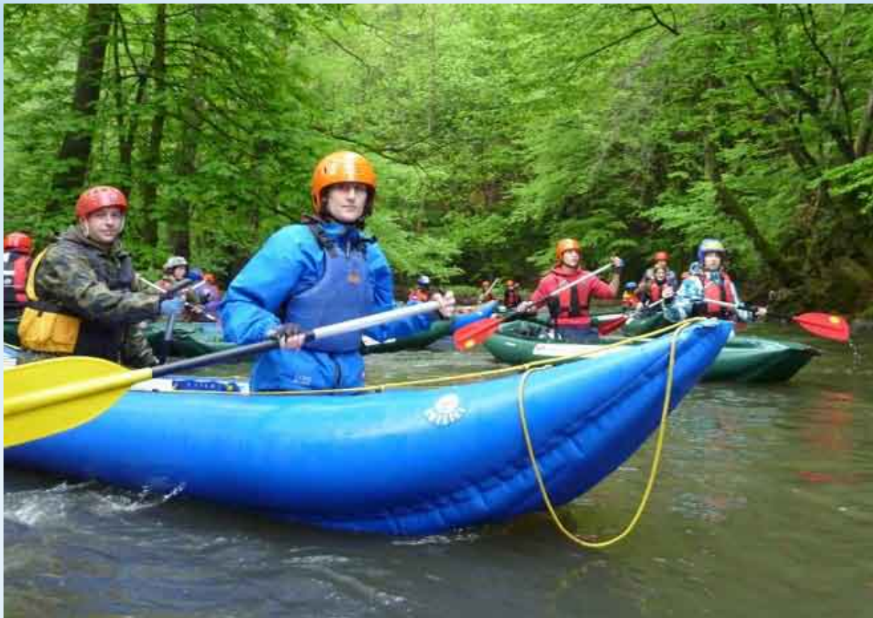
Jarní splouvání řeky Svitavy, kterou farnost sv. Martina tradičně pořádá.

Vlastně se to dokonce musí změnit, protože pokud se tak nestane, pak tato společnost ztrácí pud sebezáchovy a zanikne. Takhle už skončil například Řím a jiné velké civilizace, že se rozvrátily rodinné vztahy, rozvrátila se morálka.