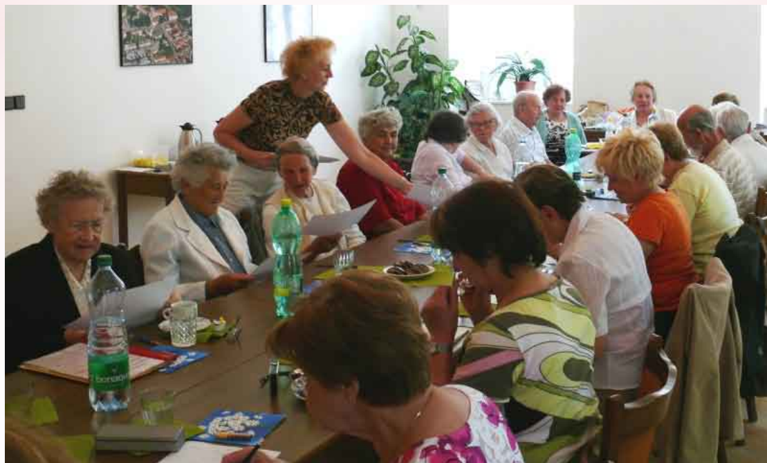
Na jednom z probíhajících KLASů.

o vzniku KLASu v městské části Brno-Řečkovice se různými kanály šířila dál a další zájemci se dotazovali, zda mohou KLAS také navštěvovat. Aby setkání byla příjemná a abych se i já coby animátorka mohla všem věnovat individuálně (jednou z podmínek je totiž i dodržení maximální kapacity 15 seniorů) vznikl brzy další KLAS, který má stejnou pracovní náplň. Činnost obou KLASů se přitom podařilo skloubit tak, že probíhají ve stejný den, jeden dopoledne a druhý v odpoledních hodinách. Když tedy občas někdo z nějakého důvodu nemůže přijít, stačí si pouze vyměnit např. dopoledne za odpoledne a o činnost není ochuzen. Navíc – díky společným exkurzím, návštěvám výstav nebo zájezdům, se navzájem všichni znají. Oba KLASy provozuje a finančně zajišťuje městská