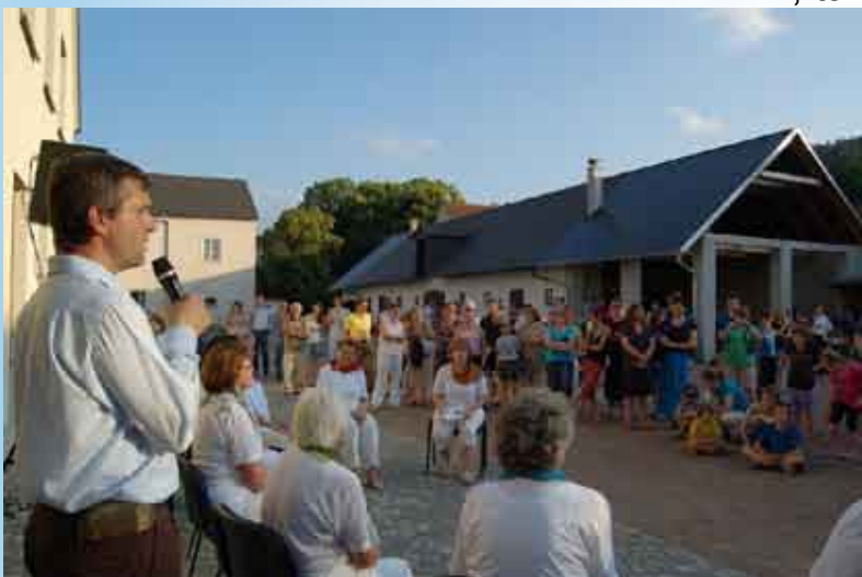
Gardenparty na faře sv. Martina.

Nápad je to dobrý, protože pomůže oběma stranám. Jestliže to mezi nimi takzvaně zajiskří, tak to vůbec nemůže být na škodu, naopak. Poněkud kostrbaté je to samotné navázání vztahu, které je zprostředkované, v podstatě na objednávku. Například v rámci farnosti může tento princip fungovat o trochu víc rodinněji. Protože zde se třeba rodina se svou potencionální náhradní babičkou víc znají, nenavazují svůj vztah takříkajíc od píky.