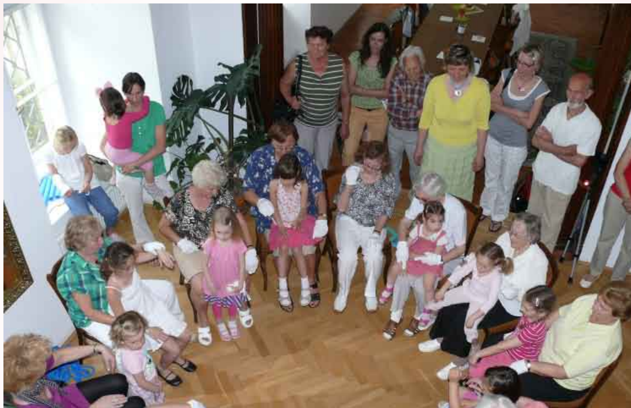
Na jednom z probíhajících KLASů.

naučit a elánem, energií, kterou v sobě mají. Naučila jsem se např. i to, že pohyb o francouzských holích není vůbec překážkou v zápase petanque! Důležité je totiž to, že hrajeme a pobavíme se. Přitom se všichni snažíme dodržet naše heslo: „Tři úsměvy denně – nejméně!“